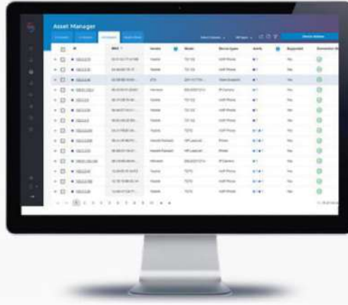
SCADAFence IoT Güvenliđinin Varlık Yöneticisi

SCADAFence, IoT uç noktası düzenlemesi ve yönetimi için yenilikçi ve merkeziyetçi bir platform ile IoT güvenlik problemlerini ele alacak özgün bir çözüm sunar. Yüzlerce düzgün çalışmayan veya karantinaya alınmış IoT cihazlarıyla uğraşmak zorunda kalmayacaksınız, IoT cihazlarınızdaki her türlü güvenlik sorununu tek bir tıkla yönetebilir ve düzeltebilirsiniz. Aynı zamanda IoT cihazlarınız bozulmadan önce dahi cihazlarınıza yönelik maruziyetleri proaktif bir şekilde tespit edebilirsiniz. Çözüm merkeziyetçi bir düzenleme yapar ve aracısızdır.