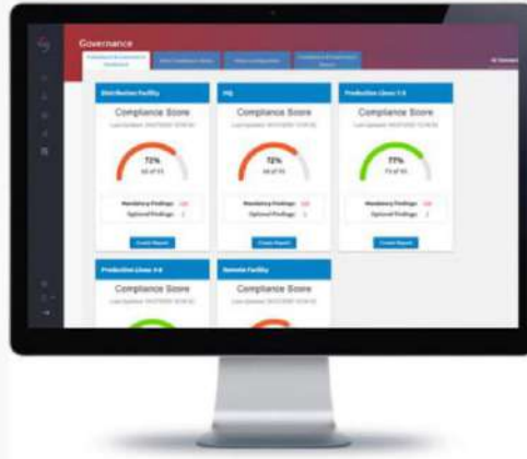
SCADAFence Yönetim Portalının Merkezi Paneli

SCADAFence Yönetim Portalı uygunluğu ölçer ve tüm alanlarda zamanla kat edilen ilerlemeyi izler. Tüm açıkları ve darboğazları tespit eder ve kullanıcıların organizasyonel güvenliğini iyileştirmek için sistematik stratejiler oluşturmalarını sağlar. Platform, BT ve OT departmanlarının merkezi olarak organizasyonel politikalara ve OT ile ilgili yönetmeliklere bağlılığını tanımlamalarını ve izlemelerini sağlar. Çözüm kolaylıkla dağıtılabilir, kesintisizdir ve OT alanlarının hiçbirinde süreç uygunluğunu tehlikeye atmaz.