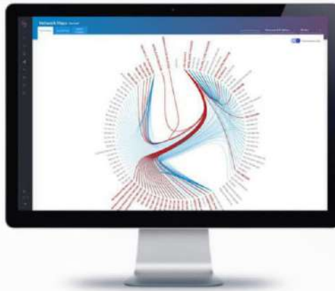
SCADAFence Platformu'nun Ağ Haritası

Uzaktan Erişim Güvenliği - Uzaktan erişim bağlantılarına tam görünürlük kazandırır. Kullanıcı profili dışındaki veya kötü amaçlı olan kullanıcı aktivitelerini izler ve tespit eder.